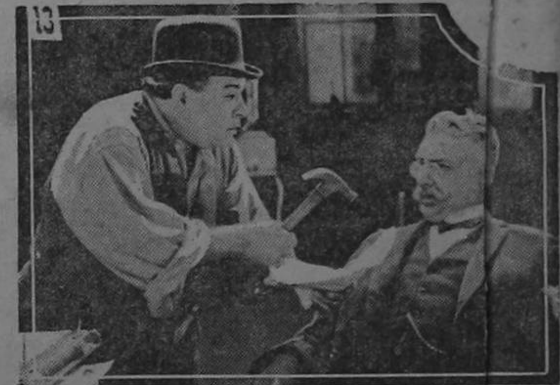
GEORGE SIDNEY and JEAN HERSHOLT in "GIVE 'EM HELL, JOHNNY" A UNIVERSAL PICTURE

Mañana en la noche tenemos un buen estreno en el Teatro Variedades, el de la producción de arte norteamericano "Dando y Tomando" que presenta Carlos Laemmle. Es de la célebre comedia de Aaron Hoffman, creación de William Beaudine e interpretada por George Sidney, Jean Hersholt, Jorge Le-